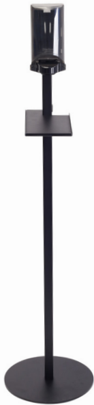
Dispenser Sterisol Art.nr. 51042