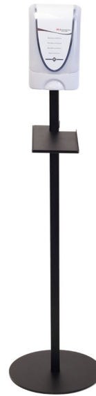
Dispenser Deb Touch Free TF2 Art.nr. 52304