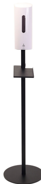
DAX Automatisk Dispenser 700 ml Art.nr. 30056